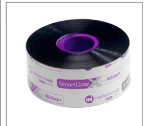
Выбор из трех типов лент и серии аксессуаров в зависимости от Ваших потребностей и типа упаковки.