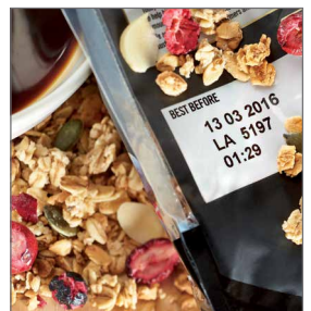
Эффективное сервисное обслуживание, гарантирующее время работы принтера и качество маркировки продукции.